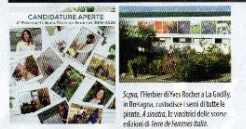
Spa Herbier de Vero Rocher a La Gialli a Fiesolano, costosa i costi di tutte le piante. A destra: le vincitrici delle precedenti edizioni di Terra de Femmine Italia.